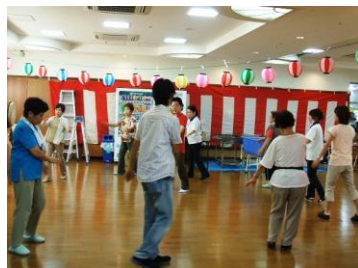
夏まつり前日の練習風景

今年で5回目の夏祭りでしたが、家族様の参加も多く利用者様と一緒に楽しく過ごしていただけたのではないかと思います。私が一番に心に残っているのは、盆踊りです。利用者様は始め見学をしていました。職員やボランティアの方と一緒に輪の中に入り楽しそうに踊っていたのが心に残っています。また、地域のボランティアの方には、準備や盆踊りの練習から当日のお手伝いまで、いつも色々な行事に携わって頂き、本当に感謝の言葉でいっぱいです。本当にいつもご協力ありがとうございます。