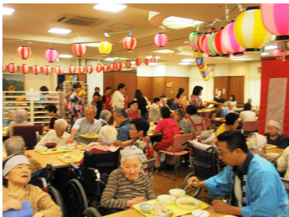
皆さんで いただきま〜す！！

第一部の屋台は、『お好み焼き』『焼そば』といった定番のものから、昨年行列の出来た『ソフトクリーム』を『かき氷』に替えたりと、新たな試みも試してみました。今年始めての挑戦は、『ベビーカーステラ』で